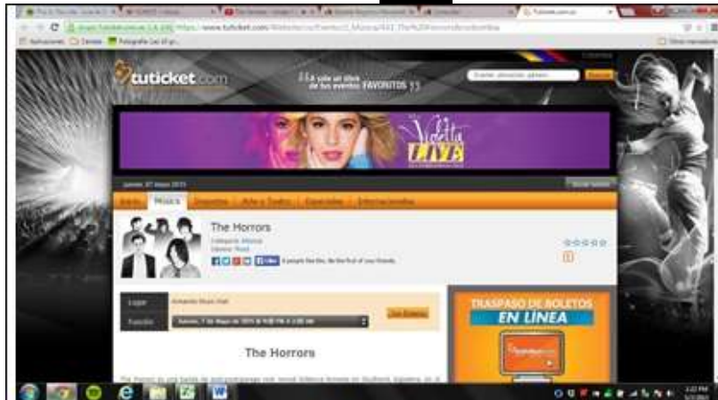
Imagen No. 1: Extraída de la Página Web de la empresa: https://www.tuticket.com/Evento/2_M%C3%BAsica/433_The%20Horrors&rockombia , el día 7 de Mayo de 2015.